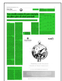
Superficie 45 %

Nel documento del 29 luglio l'Arera aveva precisato che richieste e risposte dovessero avvenire tramite posta elettronica certificata o con altro sistema tracciabile individuato dal venditore stesso. Alcuni fornitori di energia e gas avevano quindi predisposto i moduli da compilare e inviare via Pec, che potranno essere aggiornati.