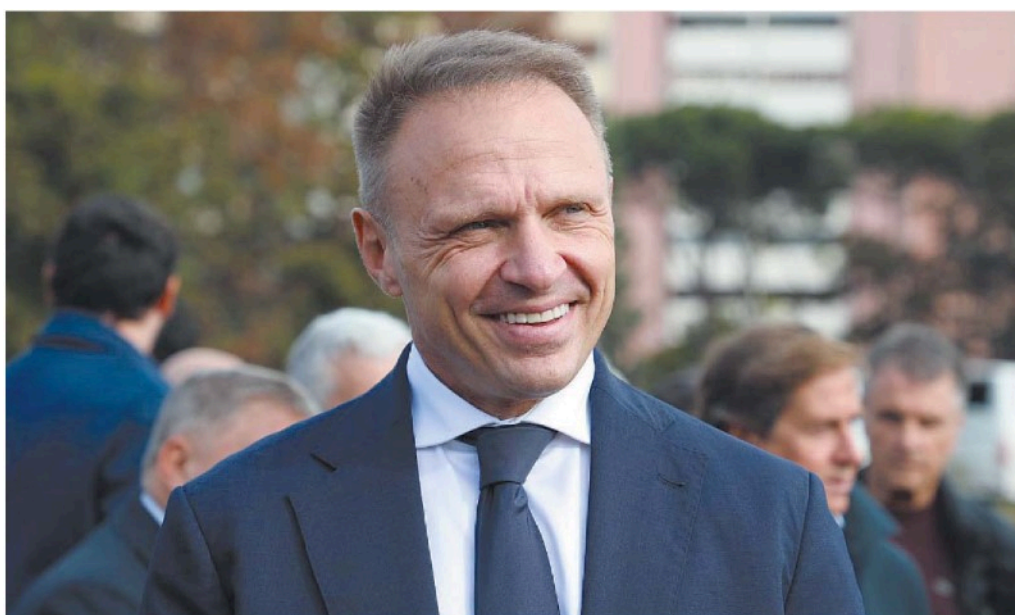
LA SFIDA DELLA SOVRANITÀ Francesco Lollobrigida è ministro dell'Agricoltura e della sovranità alimentare dallo scorso 22 ottobre (us)