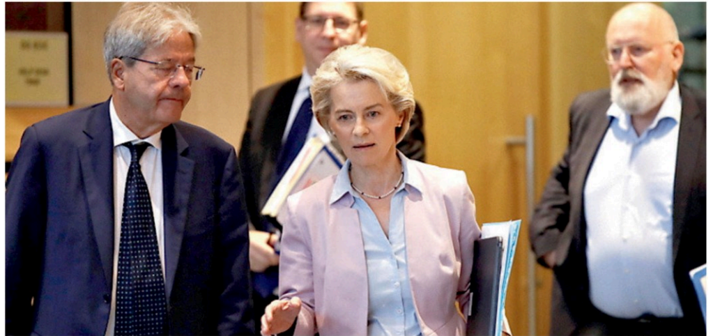
Il commissario Ue all'Economia, Paolo Gentiloni, con la presidente della Commissione, Ursula von der Leyen