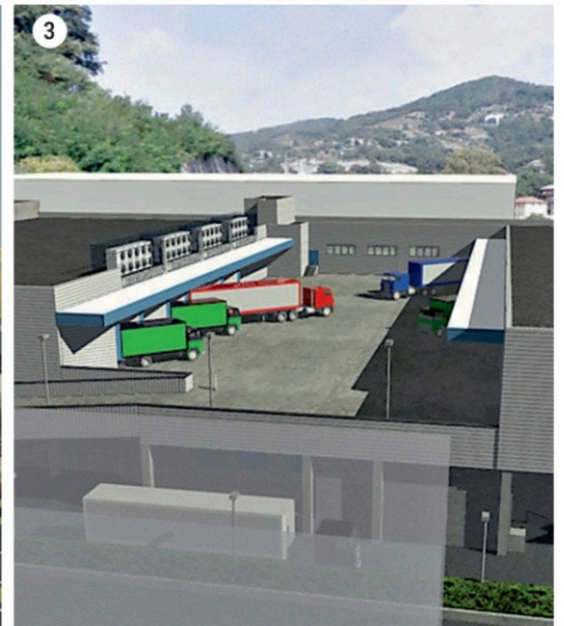
1-2) L'area di Campi dove sorgerà il nuovo supermercato Basko, il più grande dell'insegna a Genova; 3-4) i render della futura piattaforma logistica di Trasta: l'inaugurazione è prevista entro metà 2026