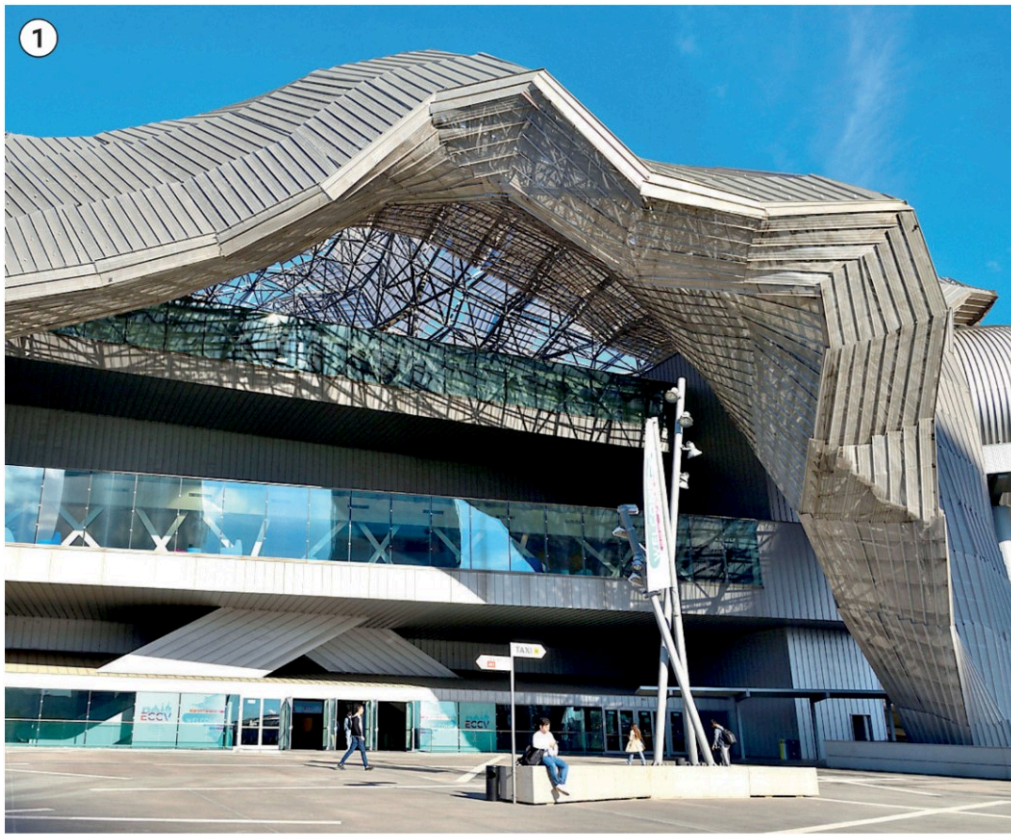
① La prima edizione di NetZero Milan si terrà dal 14 al 16 maggio 2025 all'Allianz MiCo

Solo il 50% delle imprese ha fissato gli obiettivi di decarbonizzazione